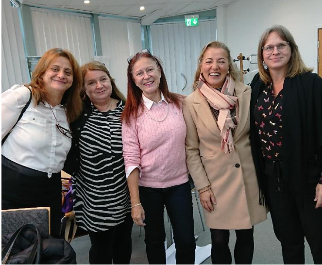
Några av de glada deltagarna på Schyst arbetsliv.

I avdelningens regi har det sen sist varit två utbildningar; Schyst arbetsliv och ombuds- och skyddsombudsutbildning.