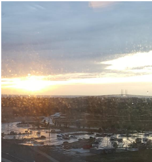
Morgonutsikt från Quality Hotel View i Hyllie där förbundsmötet hölls.

Andra dagen startade äntligen utskottsarbetet och det var dags att ta tag i alla motionerna. Jag var med i ekonomiutskottet. Vi behandlade bland annat arvode till valutskott och styrelsen, skärpta regler för uthyrning av förbundets lägenheter, stipendier vid studier.