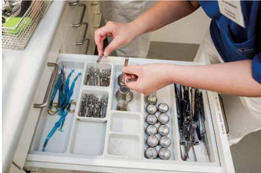
På kliniken i Hageby finns en mötesstruktur: varannan vecka är det tandsköterskemöte där man pratar om rutiner i exempelvis sterilen eller får information om nya material.